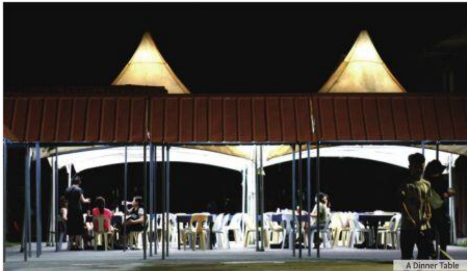
A Dinner Table