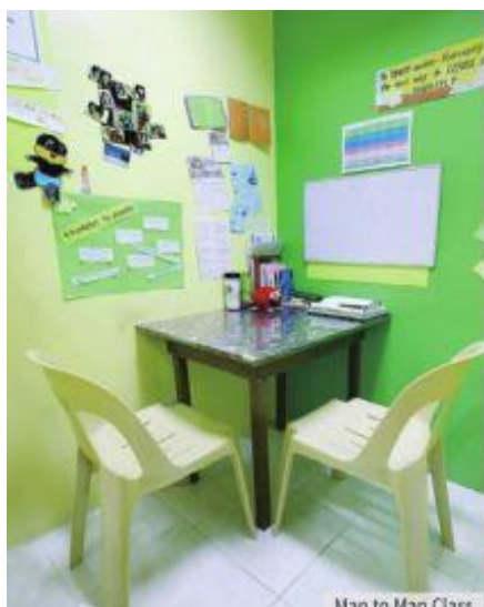
Man to Man Class