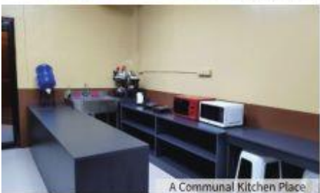
A Communal Kitchen Place